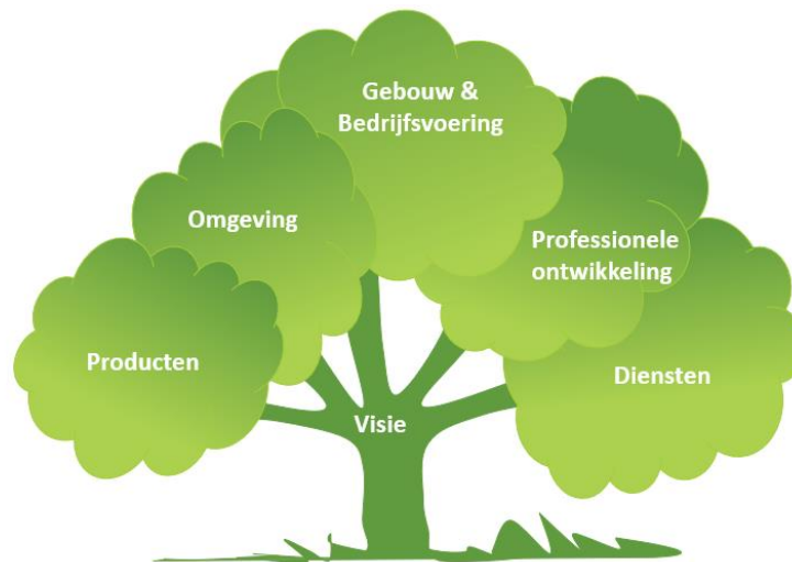
Het WEA-model voor duurzame ontwikkeling

De integrale benadering (WEA-model) voor duurzame ontwikkeling ondersteunt organisaties om hun duurzame beweging te starten en te werken aan de SDG's van hun keuze. Dat betekent denken vanuit verschillende veranderdomeinen zoals uw producten, diensten, uw gebouw en bedrijfsvoering én deze te verduurzamen. Het roept ook vragen op over de expertise die organisatie hiervoor nodig heeft (professionalisering) en welke partners en stakeholders (netwrk) kunnen bijdragen aan deze ontdekkingsreis. Dit alles vanuit een gedeelde visie.