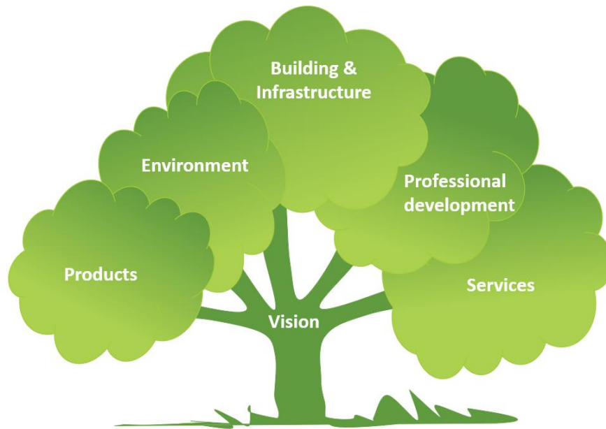
El modelo WEA para el desarrollo sostenible

El enfoque integral de la empresa (modelo WEA) para el desarrollo sostenible apoya a los centros empresariales y a los inquilinos para que inicien su movimiento sostenible y trabajen en los ODS de su elección. Eso significa pensar desde el punto de vista de diferentes dominios de cambio, como sus productos y servicios y operaciones comerciales y de construcción, y hacerlos más sostenibles. También plantea preguntas sobre la experiencia que los centros empresariales necesitan para esto (desarrollo profesional) y qué socios y partes interesadas (Medio ambiente) pueden contribuir a este viaje de descubrimiento. Todo esto se hace sobre la base de una visión compartida.